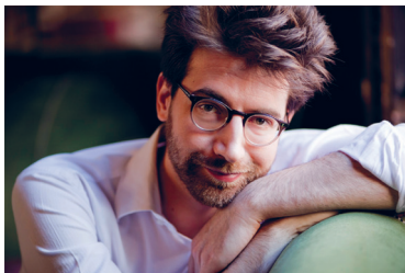
— Gabriele Carcano piano